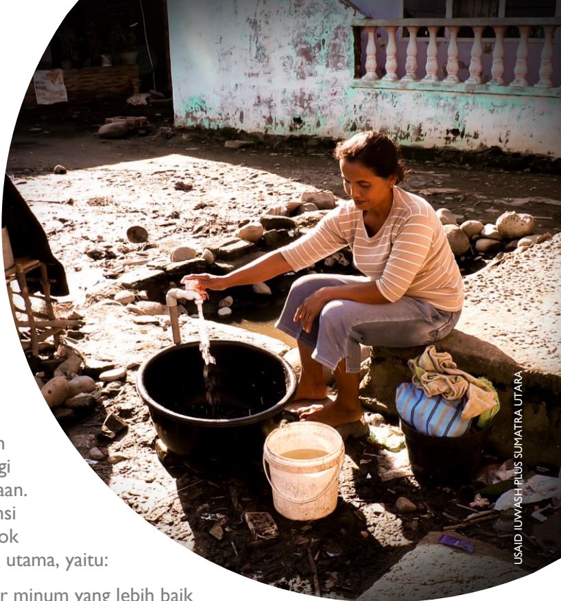
USAID IUWASH PLUS SUMATRA UTARA

Di Sumatra Utara, USAID IUWASH PLUS bekerja di lima kabupaten/kota, yaitu Kota Medan, Kabupaten Deli Serdang, Kota Tebing Tinggi, Kota Pematangsiantar, dan Kota Sibolga.