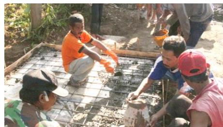
USAID IUWASH PLUS

CSR adalah solusi yang menguntungkan bagi masyarakat dan perusahaan. Masyarakat bisa mendapatkan manfaat nyata dari dukungan program CSR, yaitu peningkatan kualitas hidup. Di sisi lain, perusahaan dapat memperoleh keuntungan secara substansial, yaitu membuktikan kepada karyawan dan pelanggan bahwa perusahaan benar-benar peduli kepada masyarakat yang mereka layani. Hal tersebut secara tidak langsung dapat mendorong masyarakat untuk memberikan apresiasi positif kepada perusahaan, di antaranya dalam bentuk penggunaan produk dan jasa mereka yang akan berdampak pada suasana kondusif perusahaan untuk beroperasi secara optimal.