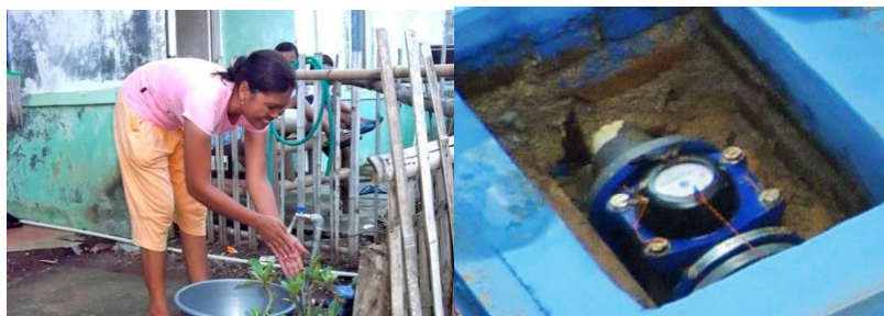
USAID IUWASH PLUS

Garis biru menunjukkan wilayah tanggung jawab PDAM untuk menyalurkan air ke Master Meter dan garis kuning adalah wilayah tanggung jawab kelompok swadaya masyarakat untuk menyalurkan air ke rumah konsumen.